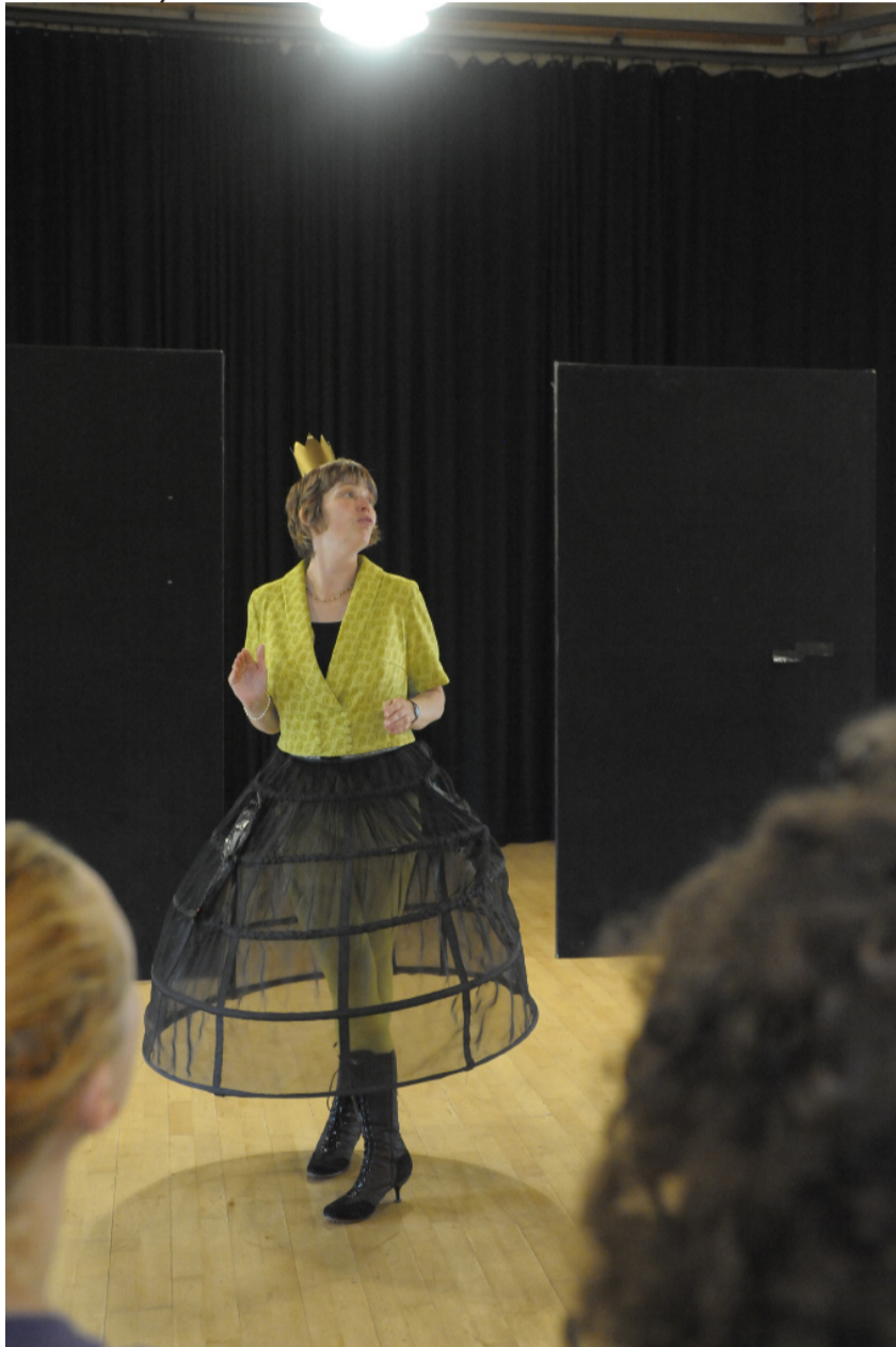
Lone med den skarpe næse svinger torsdag eftermiddag sine prinsessestøvler for børnene.

P I aften kl. 20.30 i Teatersalen. Dørene åbnes kl. 20.